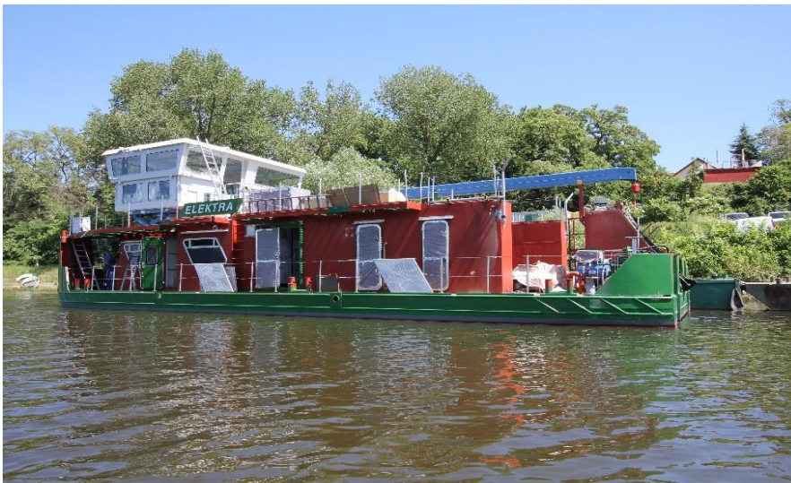
ELEKTRA an der Ausrüstungspier

Hauptversorgungspunkt ist der Heimathafen der ELEKTRA, der Westhafen der BEHALA in Berlin, wo aktuell die Planung für die Ertüchtigung der hafenseitigen Infrastruktur entsprechend mit einem Wasserstofflagerplatz und einem leistungsfähigen Stromladegalgen vorbereitet wird. Für die geplanten Fernfahrten nach Hamburg steht zusätzlich der Hafen Lüneburg als Bereitstellungsort für Wasserstoff und elektrischen Strom zur Verfügung.